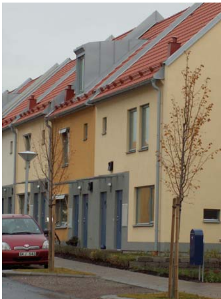
Radhus i Garnisonsområdet i Linköping

Som förebild finns radhus i Garnisonsområdet och nybyggt stadskvarter, kv Balder. Båda områdena finns i Linköping.