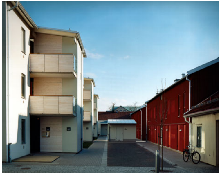
Kv Balder i centrala Linköping