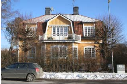
Jugendvilla på Nygatan

Bebyggelsen längs östra delen av Nygatan är delvis äldre villor med stora tomter samt radhusbebyggelse med en mindre förgårdstomt ut mot gatan. I väster domineras miljön av stora flerbefamiljsfastigheter.