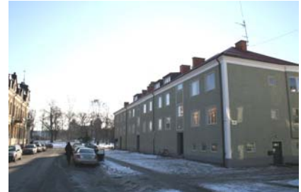
Flerbostadshus 1950-tal Nygatan