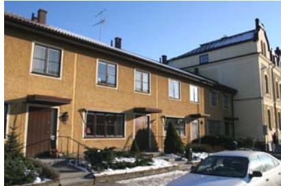
Radhus 1970-tal på Nygatan