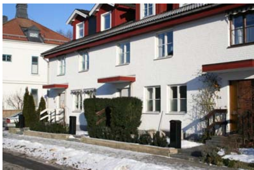
Radhus vid Nygatan