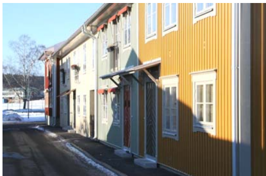
Nya bostadshus vid Kärnbogatan