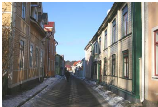
Bebyggelse vid Munkhagsgatan