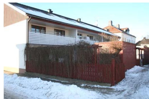
Gårdssida på radhus vid Nygatan